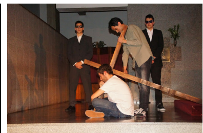
15 Abril – Páscoa Jovem "O Julgamento de Cristo"

A sua opinião é importante: Se pretende dar-nos a sua opinião ou colaboração, por favor contacte-nos através do seguinte endereço electrónico boletimparoquial@paroquia-areosa.pt