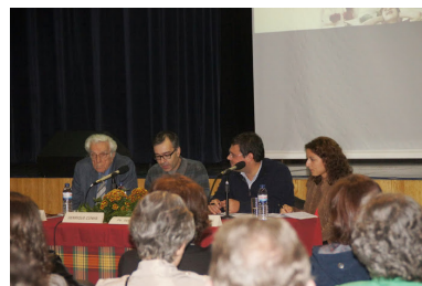
14 Abril – Encontro de Casais "A Família no Sec. XXI"